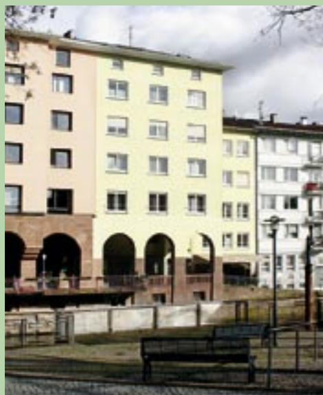
Mediterranes Flair: Die Südseite des Gebäudes mit dem Schossgatterweg liegt nahezu direkt an der Enz.