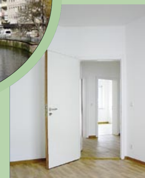
Einzigartige Lage: Das Objekt Zerrenner Straße 7/Am Schossgatter 3 wurde durch B&B komplett saniert. Jetzt freuen sich die hochwertigen 2- und 3-Zimmerwohnungen auf neue Mieter.