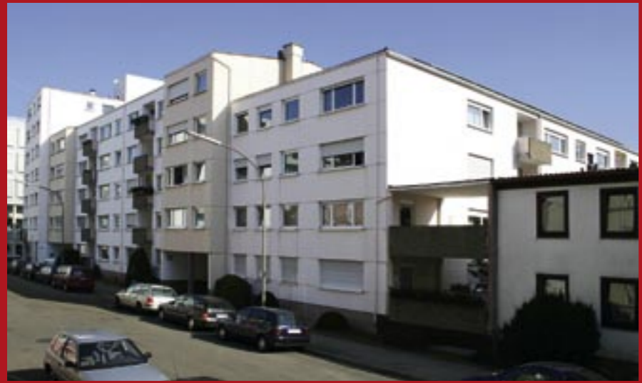
Echter Lichtblick: die Schwebelstraße 1-5a nach der umfangreichen Sanierung

Die Aufgabe des Gebäudeeigentümers war alles andere als einfach: 56 bewohnte Wohnungen sowie 2 Ladengeschäfte komplett und in möglichst kurzer Zeit zu sanieren. B&B nahm die Herausforderung an. Das Ergebnis: nach nur 4 Monaten erstrahlt die Schwebelstraße 1-5a wieder in neuem Glanz.